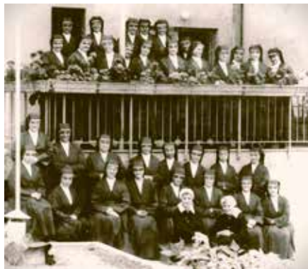
Slovenske usmiljenke v Beogradu