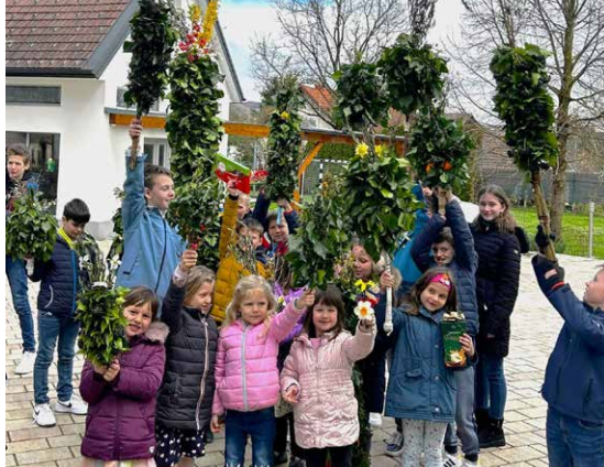
Butarice na cvetno nedeljo