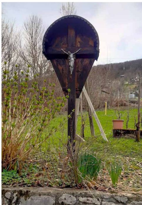
Šibčev ali Okleščenov križ stoji ob poti, ki vodi iz gozda do vznožja vinogradov na Ljubnu. Stoji poleg vikenda in vinograda katerega lastniki so Okleščeni.