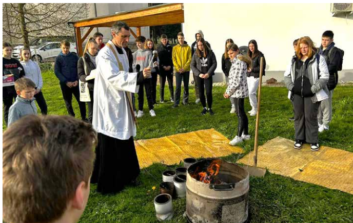
Blagoslov ognja na veliko soboto zjutraj

❖ V nedeljo, 2. junija, ob 10. uri bo sv. maša ob praznovanju zakonskih jubilejev . Če bo lepo vreme, bo po maši še župnijski piknik in nogometni turnir. Jubilanti bodo v kratkem še posebej povabljeni. Prosimo vas, da nas obvestite, če vabila morda niste dobili, saj ste vsi dobrodošli.