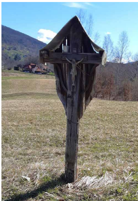
Turkov ali Veselov križ stoji na koncu vasi na njivah. Pot, ki gre mimo križa vodi v del vasi, ki se imenuje Reber.