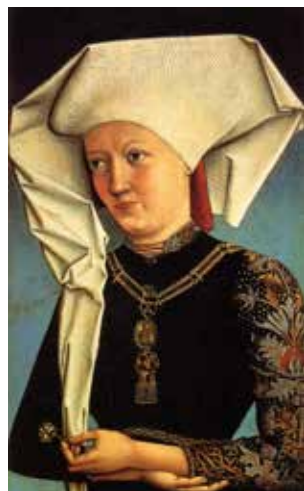
Upodobitev sv. Emme Krške iz sredine 16. stoletja

Mislím, da je sv. Emma Krška ženska, ki je v življenju prestala veliko preizkušenj, a pri tem ni obupala, ampak šla naprej, zato se moramo vsi zgledovati po njej. Na sv. Emo se lahko obrnem kadarkoli jo potrebujem, tud če ni zavetnica v težavi, ki jo imam, saj vem, da mi vedno pomaga, če molim in jo prosim.