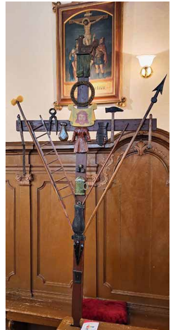
Križ z znamenji Kristusovega trpljenja v Krkavčah