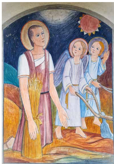
Svetemu Izidorju orjejo angeli, medtem ko on moli.

❖ Slovesno praznovanje godu bl. Alojzija Grozdeta bo v nedeljo, 1. junija, ob 16h na Zaplazu.